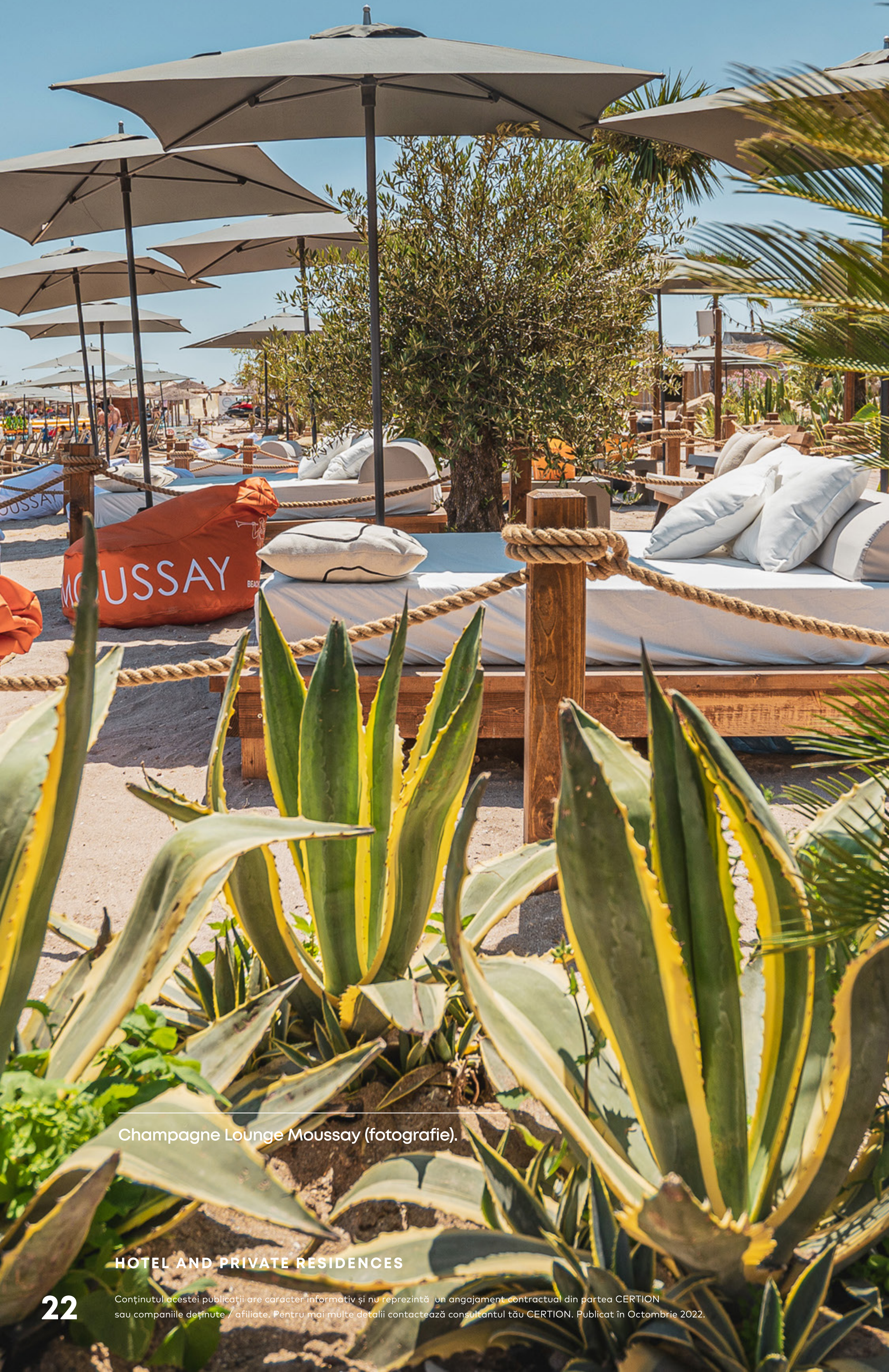
Champagne Lounge Moussay (fotografie).