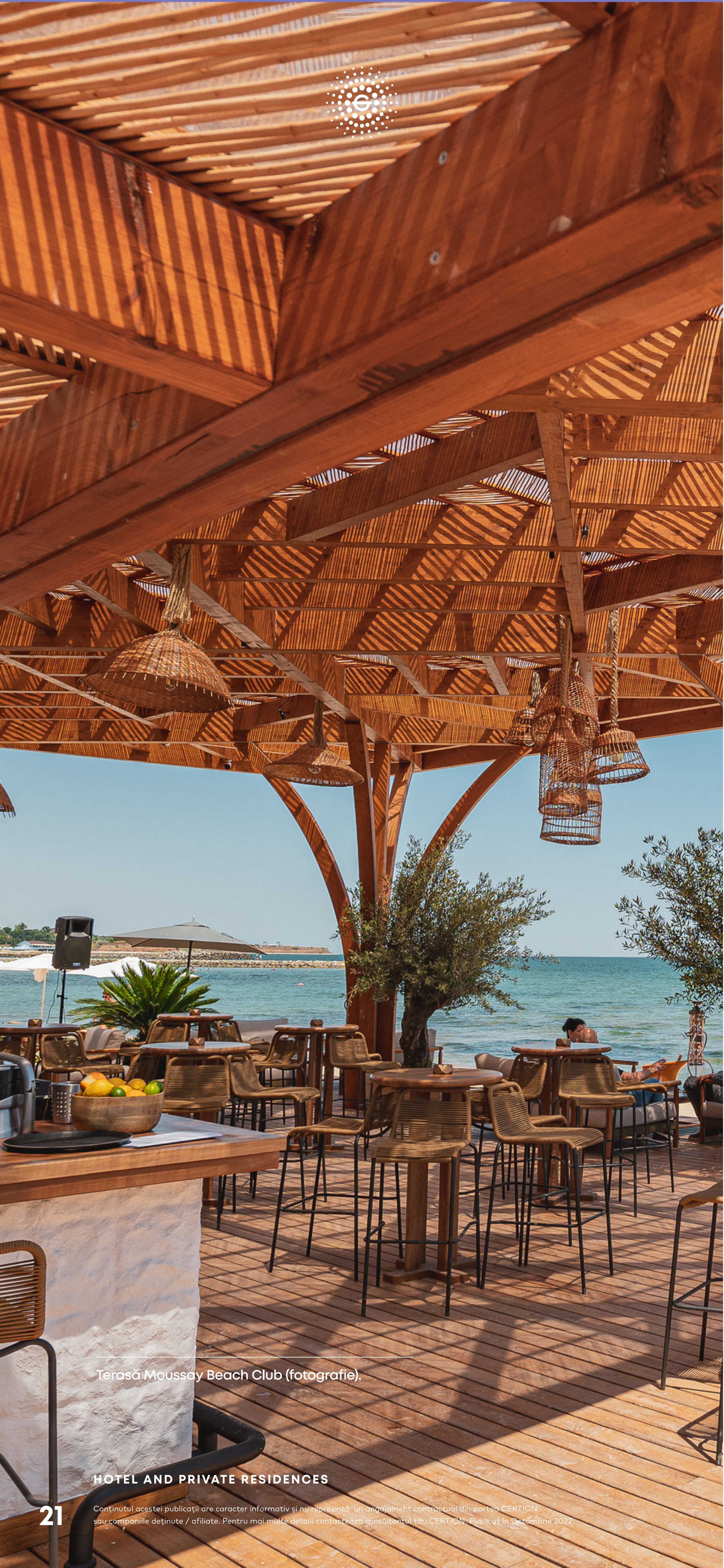
Terasă Moussay Beach Club (fotografie).